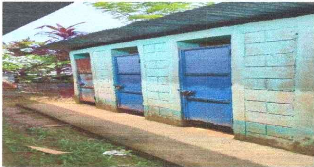
Foto 3: DETERIODO DE LAS PUERTAS DEL BAÑO, LO CUAL SE NECESITA CAMBIO DE LAS 3 PUERTAS.