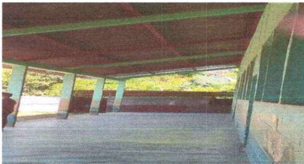
Foto 5: DETERIODO DE LAS ESTRUCTURAS, POR EL CUAL SE NECESITA CAMBIO.